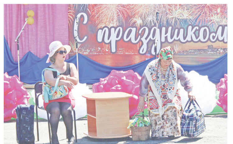
Специально для трактористов показали сценку «Городская и деревенская».