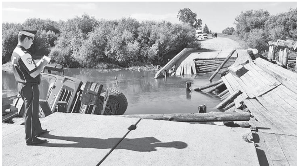
Обрушение моста произошло из-за проезжавшего по нему грузового автомобиля.

Во-вторых, на территории Байкаловского района имеются два