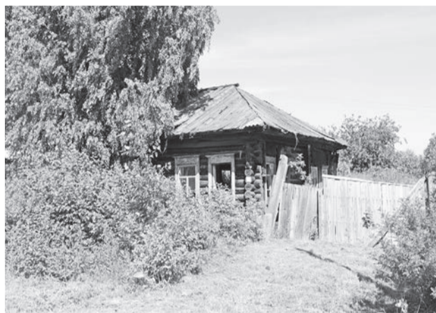
Нежилые дома есть в каждом поселении.

реестре недвижимости: «В рамках реализации мероприятий для проведения работ по исполнению федерального закона от 30.12.2020 г. №518-ФЗ «О внесении изменений в отдельные законодательные акты Российской Федерации» отдел экономики и имущества администрации Байкаловского муниципального района уведомляет о проведении меро-