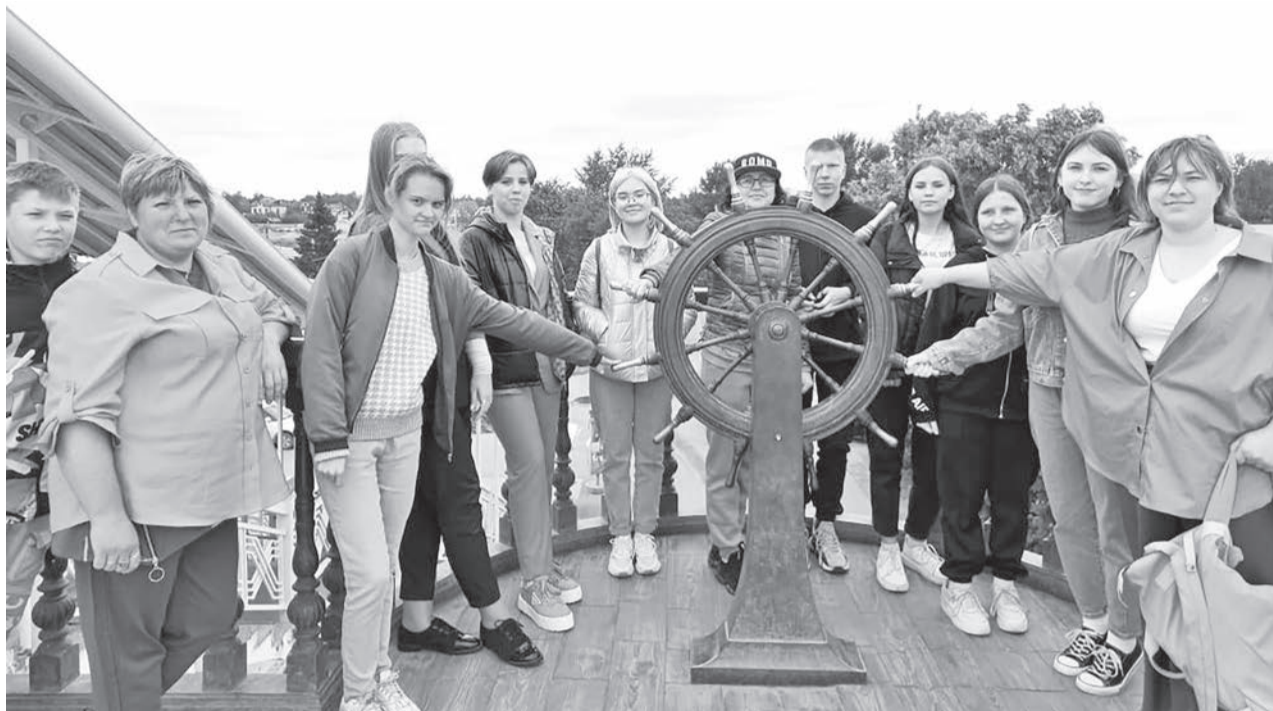
На Мосту влюблённых выпускники сделали фото на память.

Прогулка началась с исторической площади Тюмени. Экскурсовод рассказала историю о возникновении города, а около монументального художественно-исторического рельефа «Тюмень – победителям» напомнила основные моменты Великой Отечественной войны. Далее мы уже путешествовали по улицам города на автобусе. Делали небольшие остановки, например,