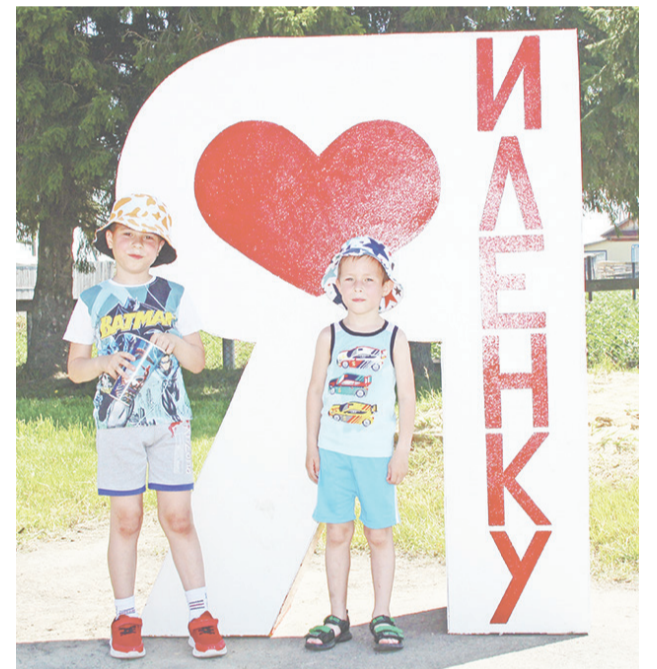
Будущее деревни – это дети.

Будущее деревни – это дети. Каждый день они спешат в уютный детский сад, затем их ждёт школа. В этом году в Нижней Иленке девять первоклассников, они придут на смену выпускникам, им пожелали не зате-