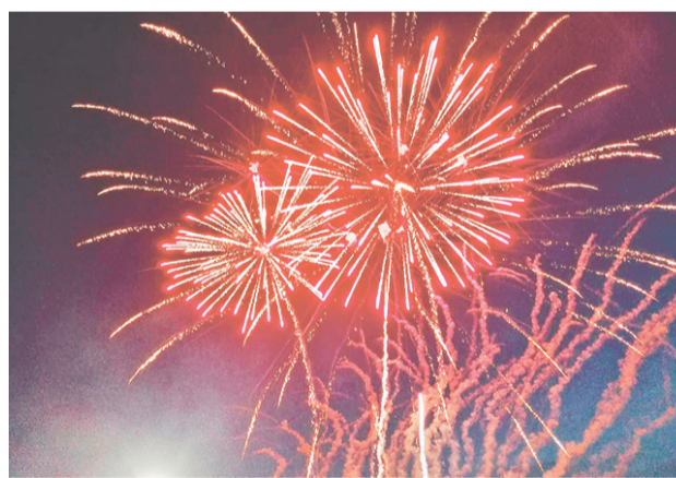
Восхитил продолжительный и яркий салют.

сделал для себя два вывода. Первый: сейчас чем-то удивить байкаловцев будет уже трудно, если только привезти «Би-2», «Сплин»... или тех же «Чайфов».