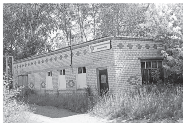
В Байкалово нежилые здания остались в основном от СПК «Байкаловский».