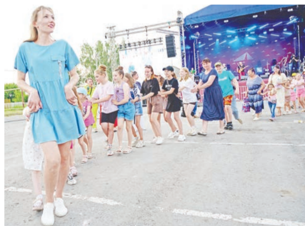
В этот день на площади были и рэп, и массовая ламбада...

ского района ещё не было. В российскую историю точно.