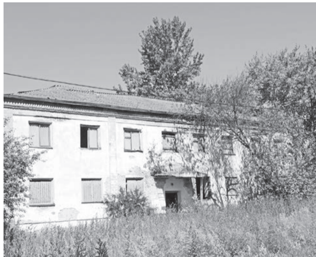
Больше всего бесхозных строений в Чурмане, некоторые остались от бывшего совхоза.