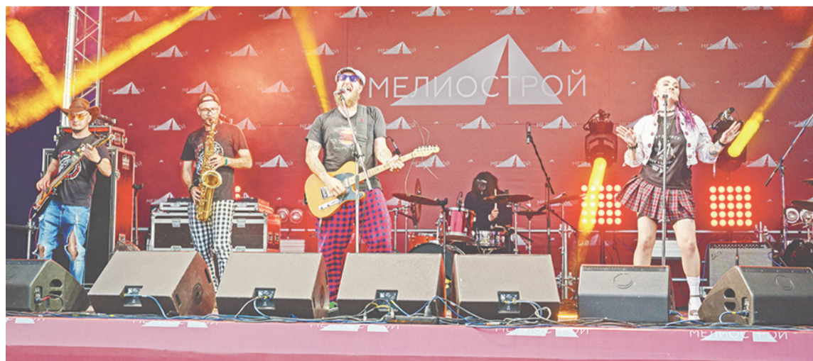
Артисты подарили зрителям незабываемые впечатления.