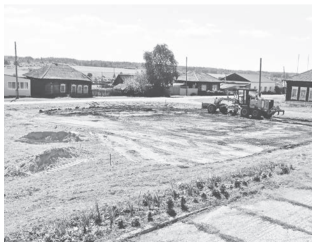
Пока ведутся подготовительные работы.

Строительство ведётся на средства, заложенные в бюджете Краснополянского сельского поселения.