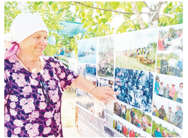
Многие узнавали себя на старых фотографиях.

Около 50 человек собрались на праздник. Съехались люди со всех сторон нашей необъятной Родины: из Волгограда, Артёмовского, Асбестовского, Талицкого районов. Пели, шутили, читали стихи о деревне, угощали друг друга за общим столом, играли в юмористические игры, была орга-