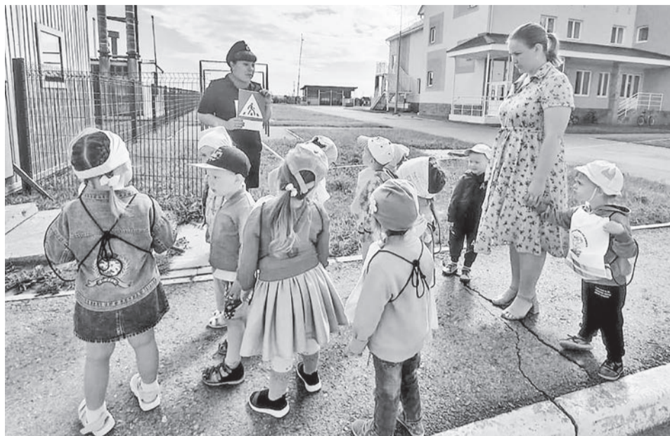
Ребята пообещали соблюдать правила дорожного движения.

В Байкалово на пешеходную экскурсию отправились совсем юные участники дорожного движения из средней группы детского сада «Теремок».