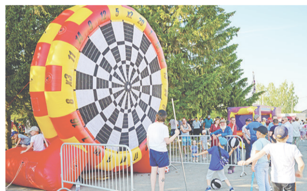
Для детей было подготовлено большое количество аттракционов.