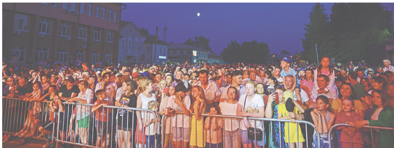
Особое внимание в этот день привлёк вечерний концерт.