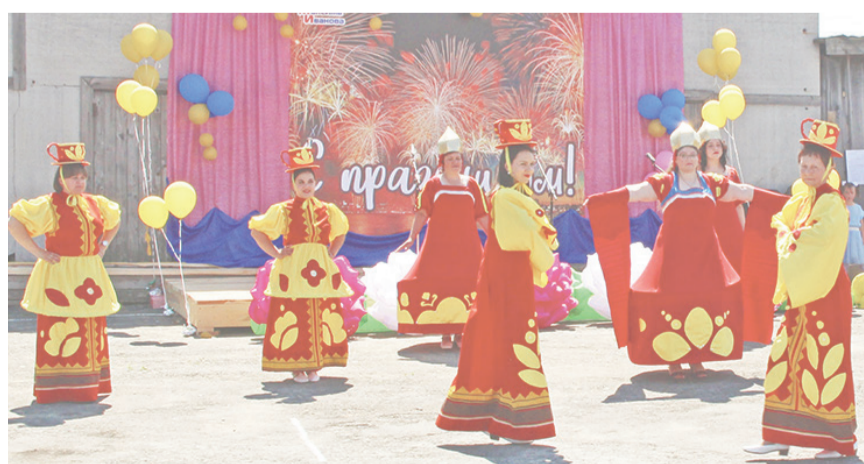
Коллектив Дома культуры и участники художественной самодеятельности подарили работникам ферм и полей музыкальные композиции.

Ведущие рассказали, что первое упоминание о Нижней Иленке было более 370 лет назад. Она относилась к Гуляевскому приходу. Что же представляет Нижнеиленская