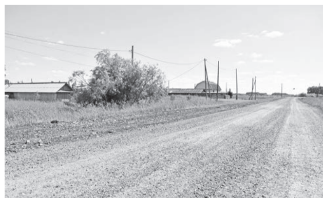
В Городище щебнем укреплена улица Безымянная.